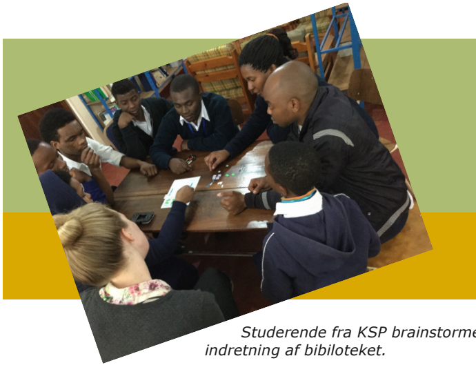
Studerende fra KSP brainstormer på indretning af biblioteket.