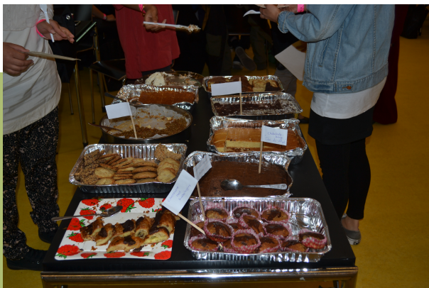
Lækre kager fra Kagens dag d. 29. April 2015

De studerende på PharmaSchool tager aktivt del i FuGs arbejde.