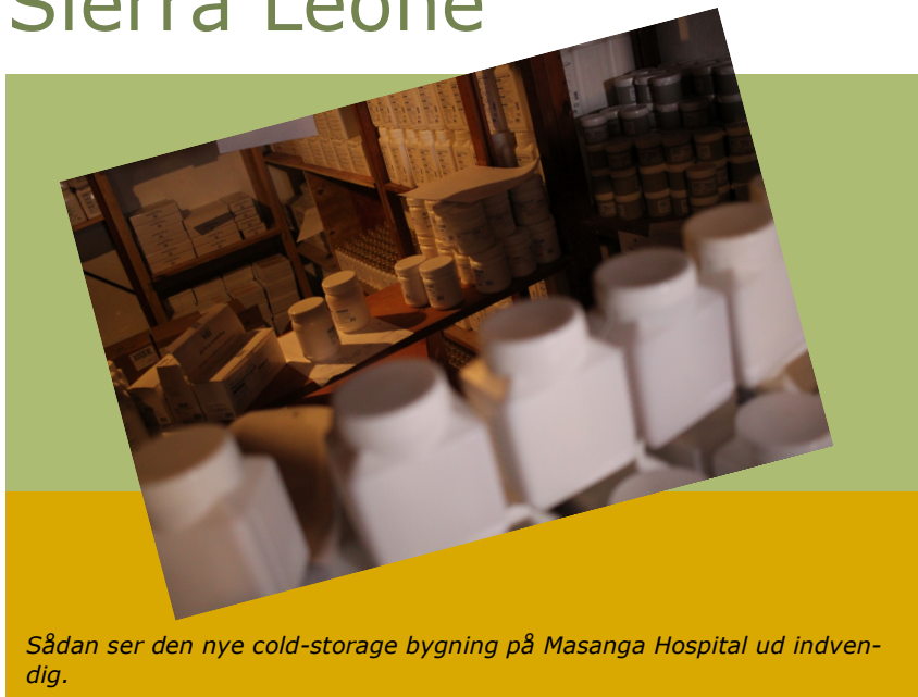
Sådan ser den nye cold-storage bygning på Masanga Hospital ud indvendig.