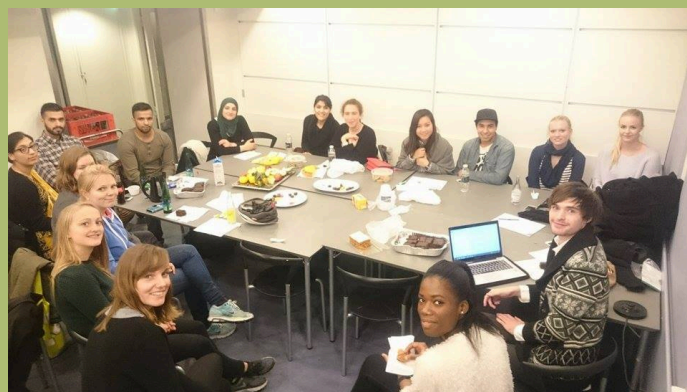
Møde i studenternetværket.

Studenternetværket har gennem året afholdt mange events og med stor succes. Der har igen i år været afholdt en introaften for studerende på Pharmaschool med et oplæg om FuG og Studenternetværket. Oplægget blev efterfulgt af et åbent møde og workshop med brainstorm af potentielle projekter i Studenternetværket.