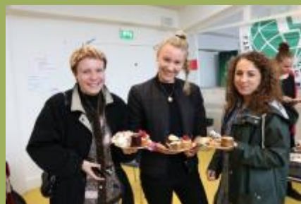
Lækre kager fra kagens dag 2016

Studenternetværket har i året 2016 haft større fokus på synlighed på PharmaSchool, København Universitet. Dette skyldes, at en spørgeskemaundersøgelse har vist at mange studerende aldrig har hørt om Studenternetværket eller FuG. Derfor valgte Studenternetværket at have større fokus på projekter, hvor Studenternetværket bedre kan repræsentere og informere om FuG.