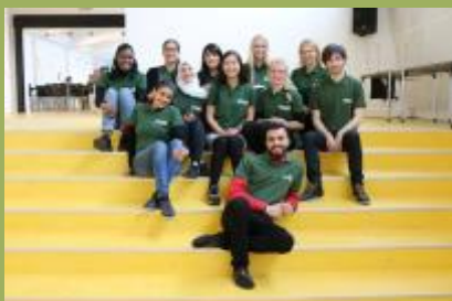
Studenternetværket i deres nye t-shirts.

De studerende på PharmaSchool tager aktivt del i FuGs arbejde.