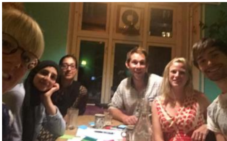
Selfie fra FuG-Mans første møde

Derudover er der rigeligt at tage sig til med mere fundraising, medlemspleje, vedligehold af visuel identitet på hjemmeside, FB og andre medier.